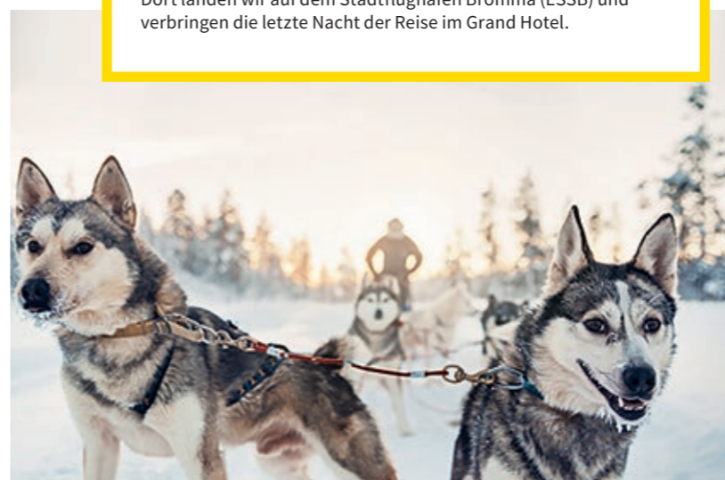
Unvergesslich! Zu zweit steuern die Gäste selbst einen Hundeschlitten durch verschneite Wälder in Lappland

TEILNAHME-INFORMATIONEN Bitte beachten Sie, dass es sich bei den ausgeschriebenen Seminaren formal um ein Übernachtungspaket mit Verpflegung und Seminarleitung mit Eigenanreise handelt. Sollten Sie zu einer bestimmten Station des Seminars und/oder zum Start- und Endpunkt nicht anreisen können und/oder die Rundreise nicht fortsetzen können, müssen wir Ihnen leider die Stornokosten des gebuchten Pakets berechnen. Ebenso sind Übernachtungen, die nicht im Paket enthalten sind, selbst zu bezahlen. Veranstalter des Seminars A001/20 ist die HTS Hanse Travel Service GmbH, Veranstalter der übrigen Reisen ist der Jahr Top Special Verlag. Wir behalten uns vor, die Seminare bei Nichterreichen einer Mindestteilnehmerzahl abzusagen. Programmänderungen vorbehalten.