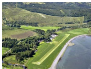
Wunderschön Der Grasplatz von Glenforsa ist ein Lunchstopp auf dieser Reise