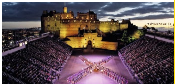
Ganz besonders Das Musikfestival Royal Military Tattoo vor dem Edinburgh Castle