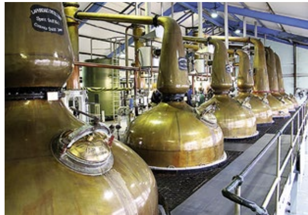
Kostbares Nass In den kupfernen Brennblasen wird bei Laphroaig schottischer Whisky destilliert, der anschließend viele Jahre in Eichenfässern reift